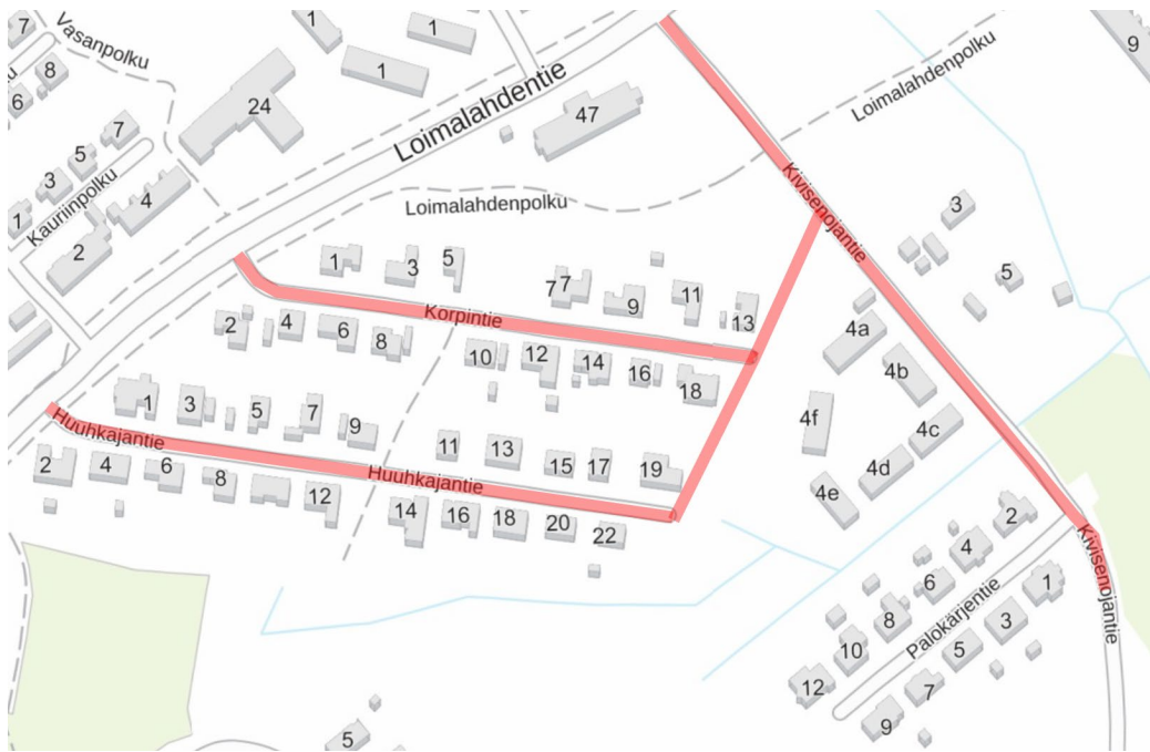
Karttaan punaisella rajattu suunnittelussa olevat alueet